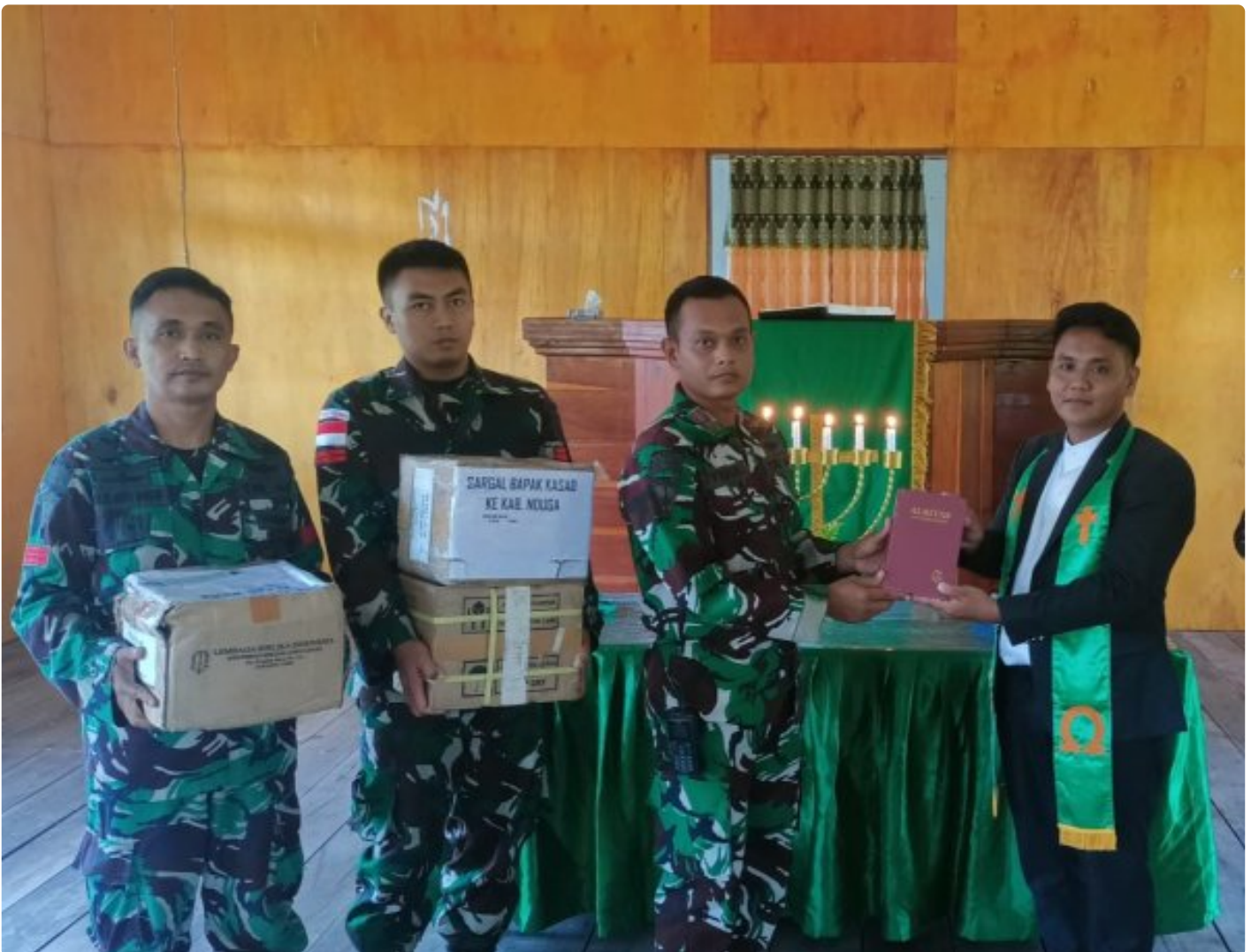
Foto: Satgas Yonif 503/Mayangkara kembali menunjukkan dedikasinya kepada masyarakat di Papua dengan memberikan dukungan alat musik untuk kegiatan ibadah di Gereja GKI Bethesda Batas Batu, Distrik Krepkuri, Kabupaten Nduga. Pada Minggu, 12 Januari 2025.

NDUGA- Satgas Yonif 503/Mayangkara kembali menunjukkan dedikasinya